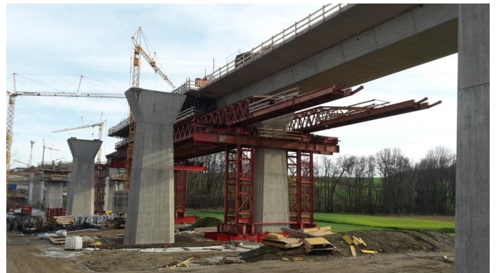
Abbildung 2 Goldachtalbrücke 36-1