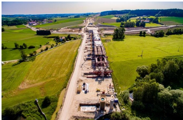
Abbildung 1 Ientalbrücke 24-1