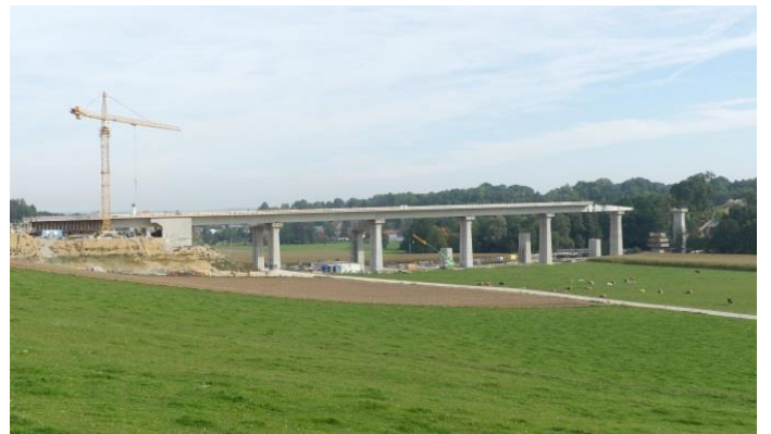
Abbildung 4 Ornaubridge 42-1