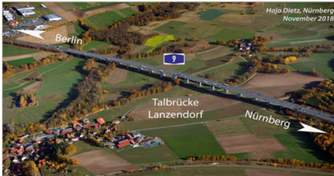
Bild 1: Instandsetzung der Talbrücke Lanzendorf zwischen der Anschlussstelle Bad Berneck/Himmelkron und dem Autobahndreieck Bayreuth/Kulmbach

Zum Austausch unter den „Jungen Kollegen“ haben wir für Sie - am 12. Sept 2019 - eine Halbtagesexkursion speziell für die „Jungen Kollegen“ geplant. Die Talbrücke Lanzendorf im Zuge der Bundesautobahn A9 ist dabei unser Ziel.